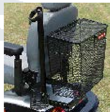
Cesta trasera con porta-bastones