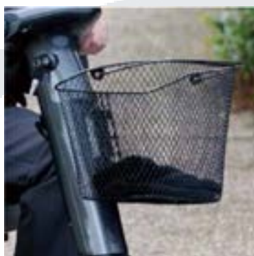
Kit cesta delantera