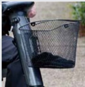
Kit cesta delantera